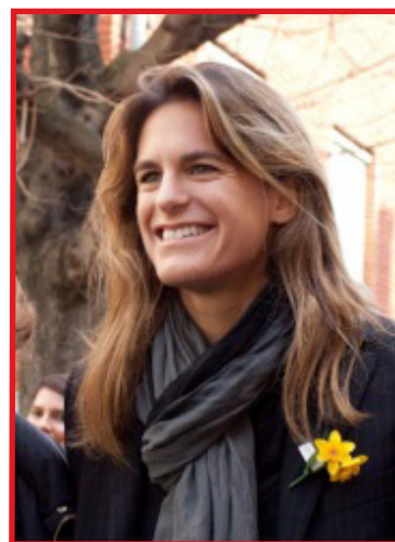
Amélie Mauresmo Marraine de l'Institut Curie

Fondation privée reconnue d'utilité publique depuis 1921, l'Institut Curie est habilitée à recevoir des dons et des legs. Les ressources issues de la générosité privée, qui représentent plus de 10% du budget, permettent d'accélérer l'innovation dans la recherche et les soins, au bénéfice des patients. Pour en savoir plus : www.curie.fr