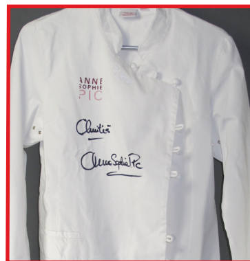
Veste de chef dédiée Don d'Anne-Sophie Pic.